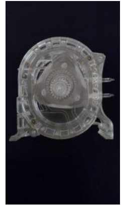
<ロータリーエンジンの模型>

残念ながら現在はロータリーエンジンを搭載した車は販売されていません。今から数年前、ロータリーエンジン車が生産中止に